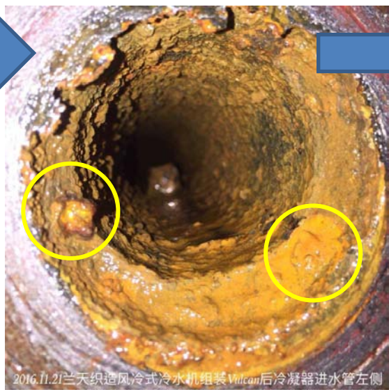
20161121风冷冷水机组冷凝器进水管左侧