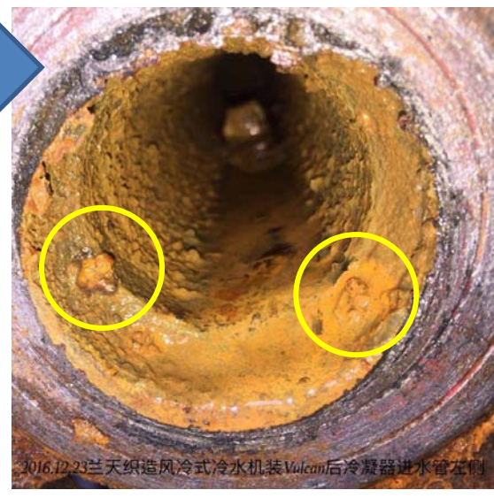
20161223风冷冷水机组冷凝器进水管左侧