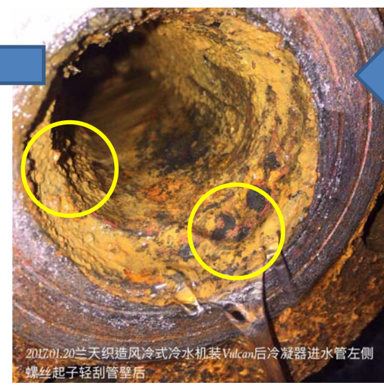
20170120风冷冷水机组冷凝器进水管左侧 螺丝起子轻刮管壁后