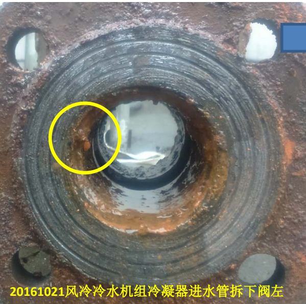
20161021风冷冷水机组冷凝器进水管拆下阀左