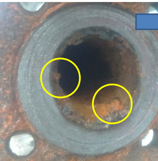
20161021风冷冷水机组冷凝器进水管左侧