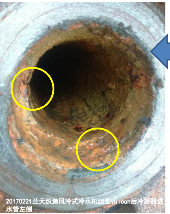
20170221风冷冷水机组冷凝器进水管左侧