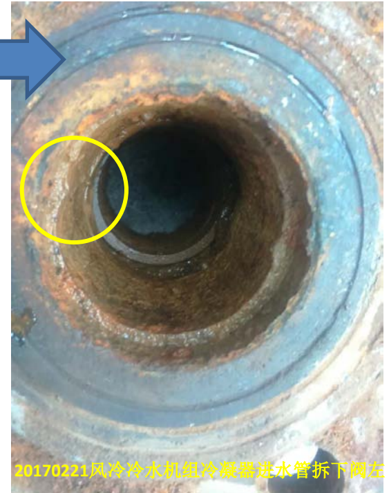
20170221风冷冷水机组冷凝器进水管拆下阀左